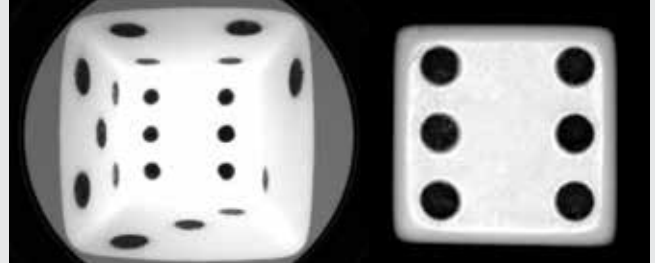
通过 Hypercentric Lens 镜头 (左)和定焦镜头所成的骰子像(右)

TECHSPEC® Hypercentric镜头提供的对象视图是聚合式的，同时时间聚集于对象的顶端和侧边，其功能是避免在机器视觉检测或鉴别应用中使用多台相机和成像透镜设置。TECHSPEC® Hypercentric镜头是检测诸如制药业的药水瓶、电池或汽车零部件等部件的理想选择。这种成像镜头能够提供提供一个圆锥形的工作区域，并且经过优化以用于单色光线。当尺寸介于0.5-1.5mm的隔圈被固定在透镜与相机间时，TECHSPEC® Hypercentric镜头还可作为长工作距离的管道镜，能够同时聚集物件的内墙和底面。管道镜的工作距离是经过标准工作区域的集合点 (CP)的某个区域。尺寸较大的隔圈可增加管道镜的焦距。注意：所有规格均以660nm进行定义。